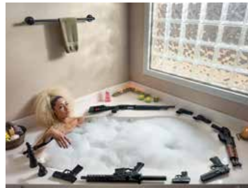
GABRIELE GALIMBERTI Aus der Serie The Ameriguns