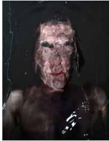
MARC-OLIVER SCHULZ Aus der Serie Wassermasken