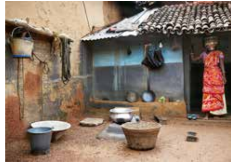
ANJA BOHNHOF Aus der Serie The Last Drop