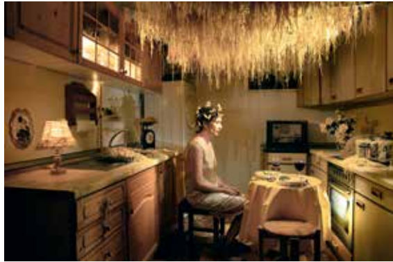
SEB AGNEW Aus der Serie Synkope