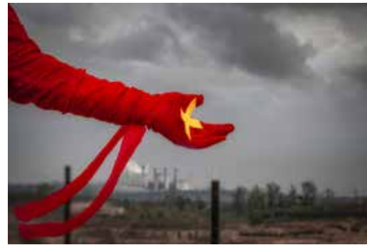
UTA SCHMITZ-ESSER Aus der Serie Verheizte Umwelt - Unruhige Zeiten im Revier